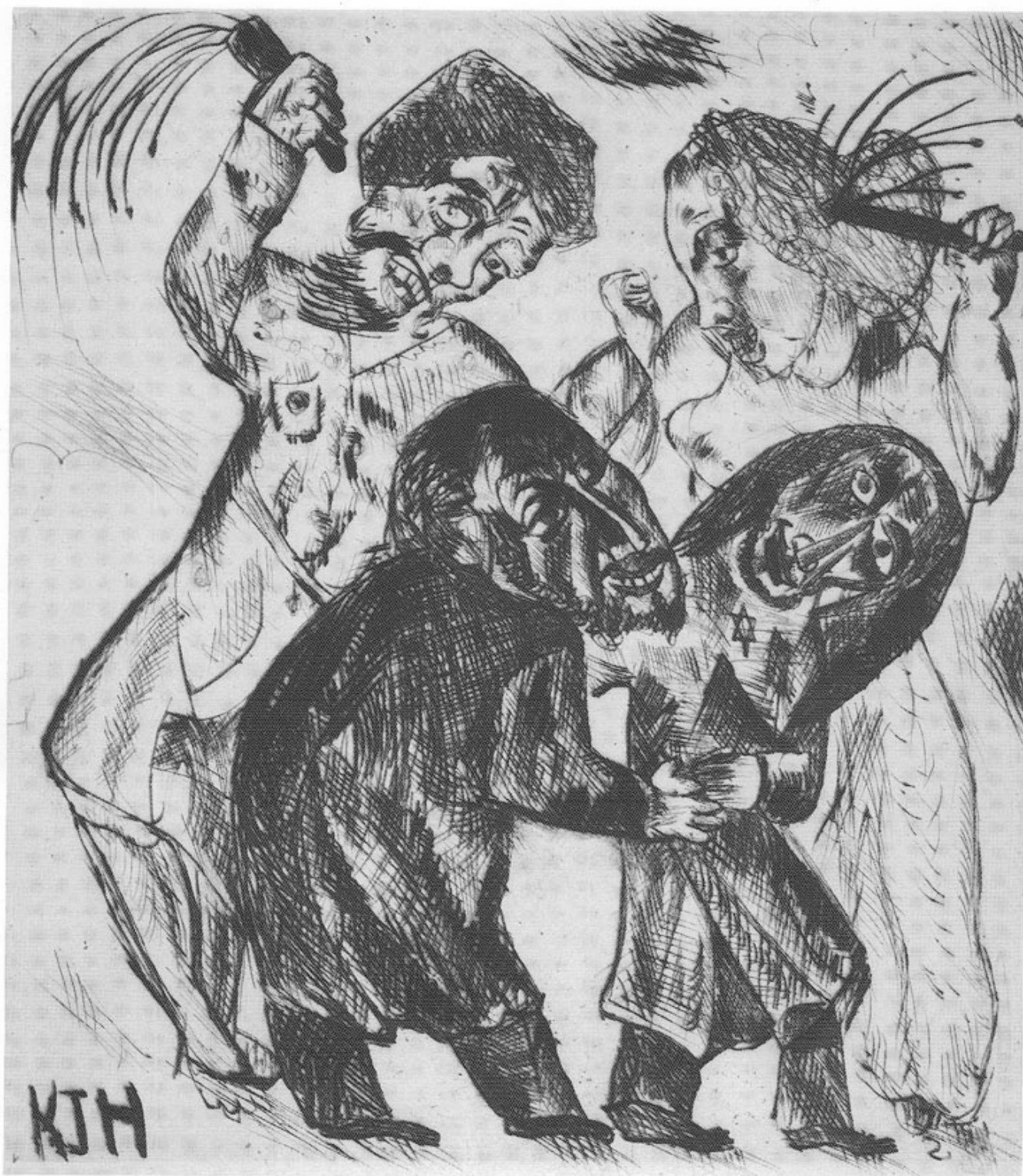
1.22.11 Die Verfolgten, auch: Geißelung, um 1922 (zu Martin Buber: Der große Maggid) 190 x 170, schwarz, Büttin bez. ul: KJH