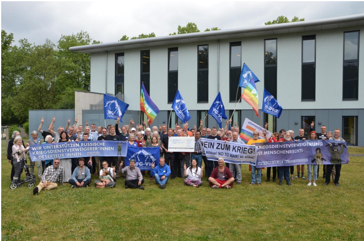
Die (Präsenz-) Teilnehmer*innen des DFG-VK Bundeskongresses 2023 in Duisburg (©StI)

DFG-VK 2023 am 20. Mai in Duisburg 1. Ludwig-Baumann-Preisverleihung, hier: Fotos von Stefanie Intveen (©StI), Köln, und Michael Schulze von Glaser, Kassel (©msg)