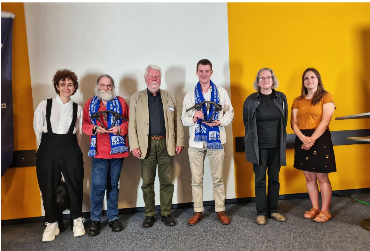
Gruppenfoto II nach der Preisvergabe