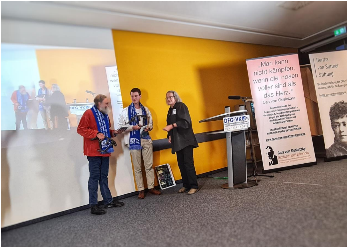
Die Preisträger und die Sprecherin des CvO-Solidaritätsfonds bei der Preisvergabe