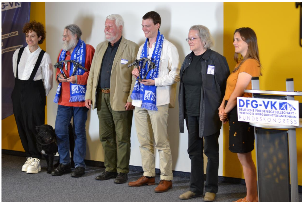
Preisträger*in und Laudator*innen / Mitwirkende