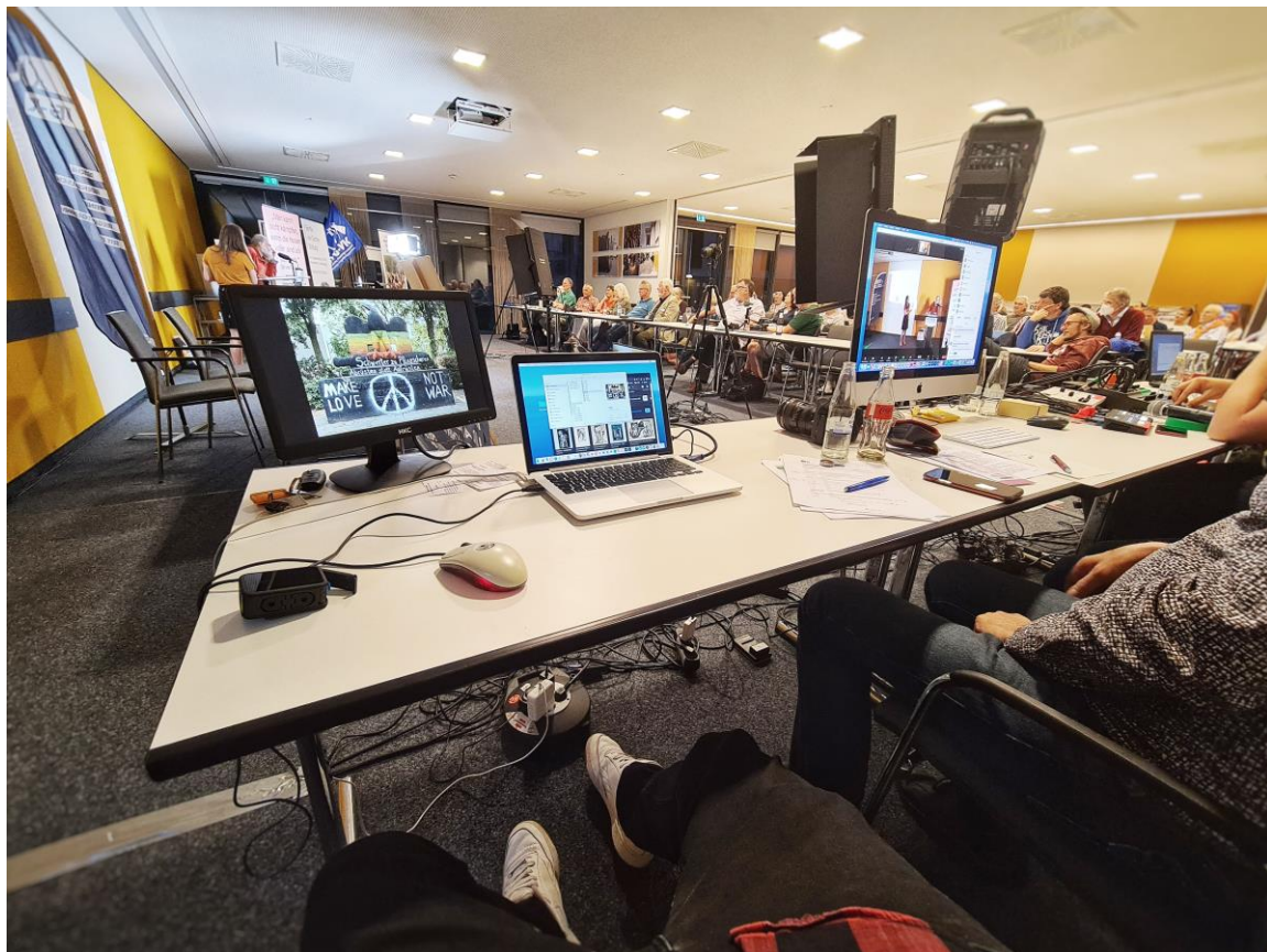
Der Bundeskongress bei der Arbeit