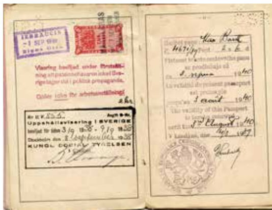
Abb. 6a-g: Max Barths tschechoslowakischer Pass (Museum für Literatur am Oberrhein/Karlsruhe: Nachlass Barth 61 )