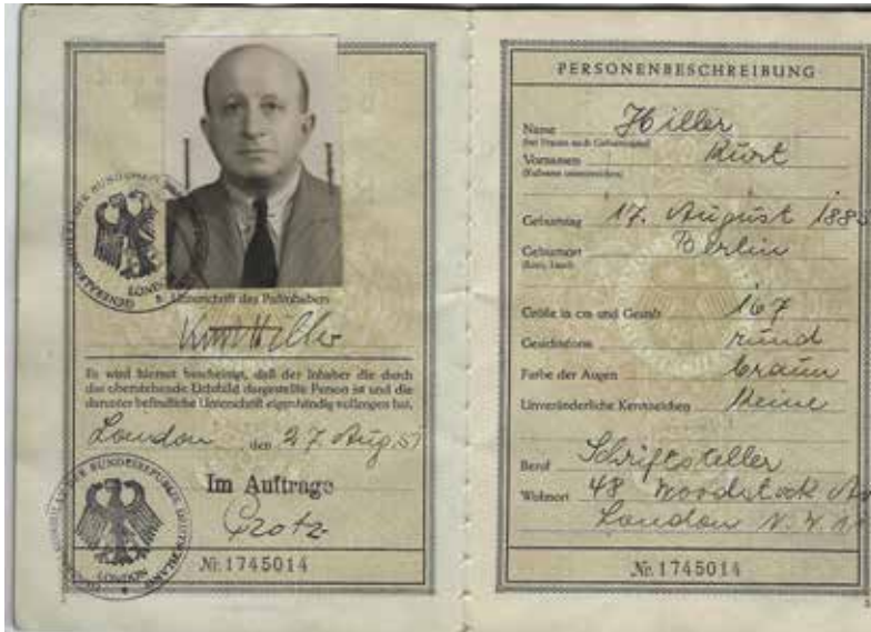
Abb. 3: Personalausweis von Kurt Hiller (1951), ausgestellt vom deutschen Konsulat in London