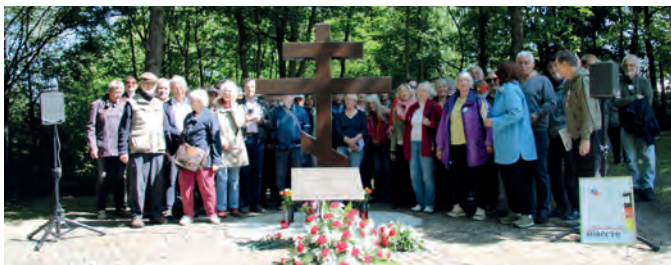
2025: Kundgebung am Mahnmal An der Reitbrake