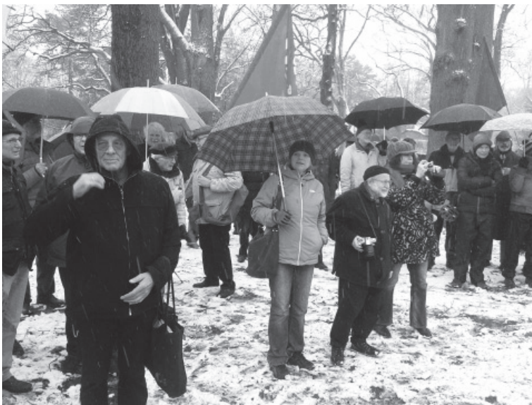
Trotz Wind und Wetter eine höhere Beteiligung

Am 14.02.2016 fand auf dem Waller Friedhof in Bremen wie in jedem Jahr eine kleine Gedenkfeier zur Ehrung und Erinnerung der bei der Niederschlagung der Bremer Räte-Republik durch das Militär des so genannten "Freikorps Caspari" im Auftrag der SPD-Regierung unter Friedrich Ebert (Befehlshaber war Kriegsmminister Gustav Noske) Getöteten statt. Unter den Delegationen der verschiedenen Parteien waren Vertreter der DKP, der MLPD, der Partei Die Linke Bremen, verschiedener Opfer-Verbände. So versammelten sich bei eisigen Temperaturen immerhin ca. 120 Menschen, die die vielen Toten wie z.B. Johann Knief und deren Eintreten für eine bessere Welt und menschenwürdige Lebens- und Arbeits-Bedingungen mit ihrem Erscheinen ehren wollten.